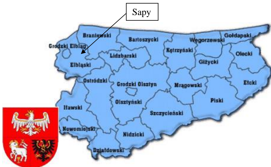
Rys. nr 2 Położenie Sap na mapie woj. warmińsko-mazurskiego.