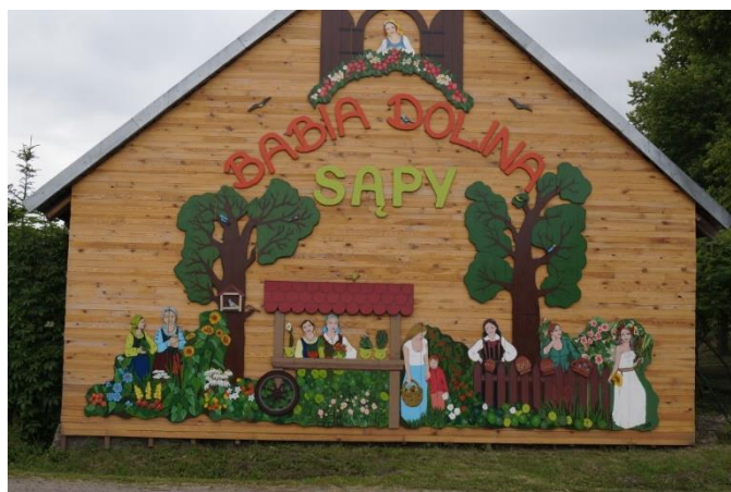
Rys. nr 5. Panoramiczny witacz wsi tematycznej Sapy „Babia Dolina”

Charakterystycznymi elementami naszej miejscowości są witacze - drewniane rzeźby Bab witające przyjezdnych. Największy z nich to panoramiczny witacz Wioski tematycznej Sapy Babia Dolina o powierzchni około 40m 2 , a także płaskorzeźby baby z numerami domów, zwyczajowe nazwy ulic.